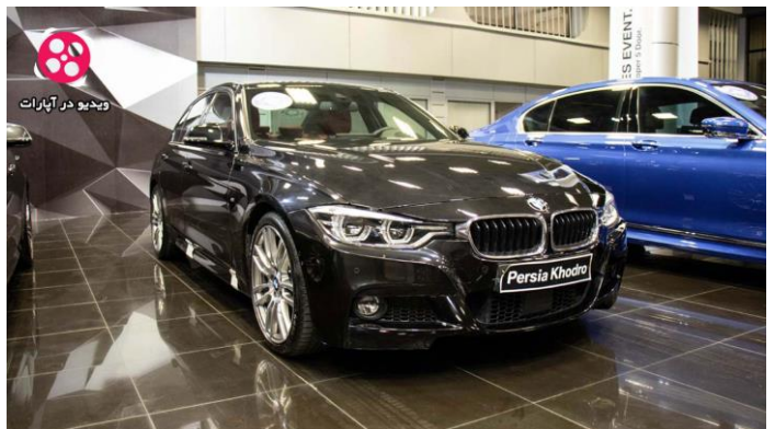
۲- زاویه سه رخ نمای جلو چپ