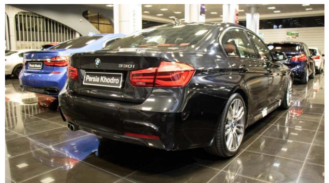
۵- زاویه سه رخ نمای عقب چپ