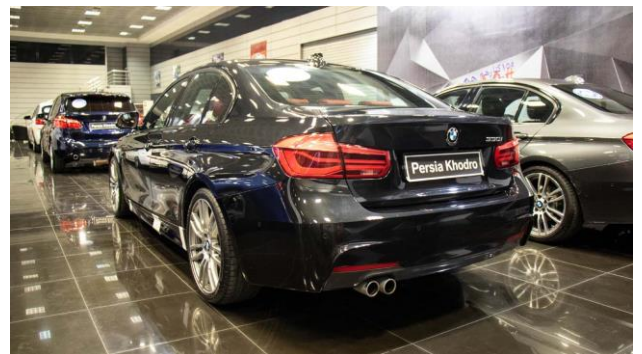
۶- زاویه سه رخ سپر و چراغ عقب راست